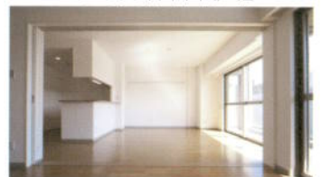
가고가와주택 (가족주택) 내부