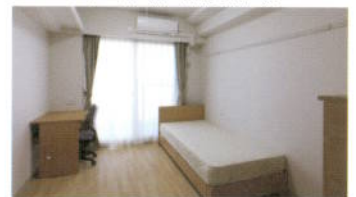
가고가와기숙사 (독신자) 내부