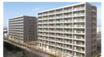
가고가와주택 (가족주택) 외관