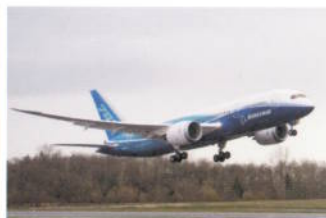
보잉 787 드림라이너