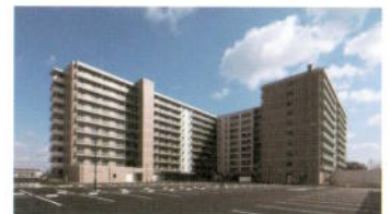
가고가와기숙사 (독신자) 외관