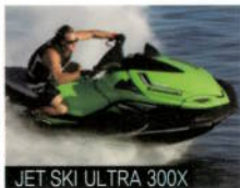
JET SKI ULTRA 300X